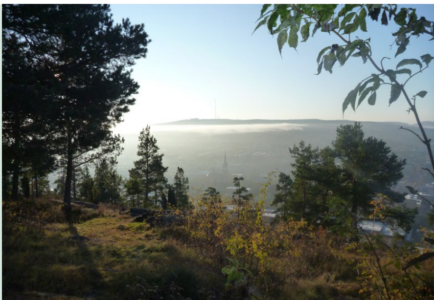
Utsikt från Norra Stadsberget till Södra Stadsberget.