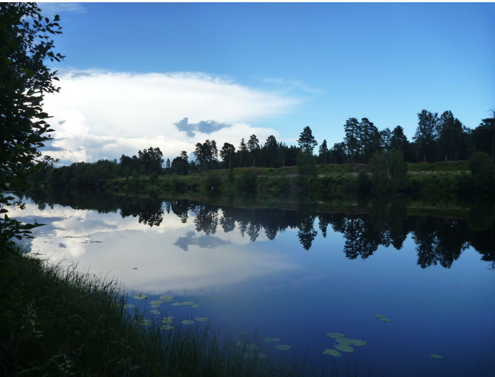
Nedre delen av Ljungan.

Människor, djur och växter rör sig och sprids oberoende av administrativa gränser. För en fungerande helhet behövs såväl högkvalitativa skyddande områden som det vardagslandskap vi alla har i våra närområden.