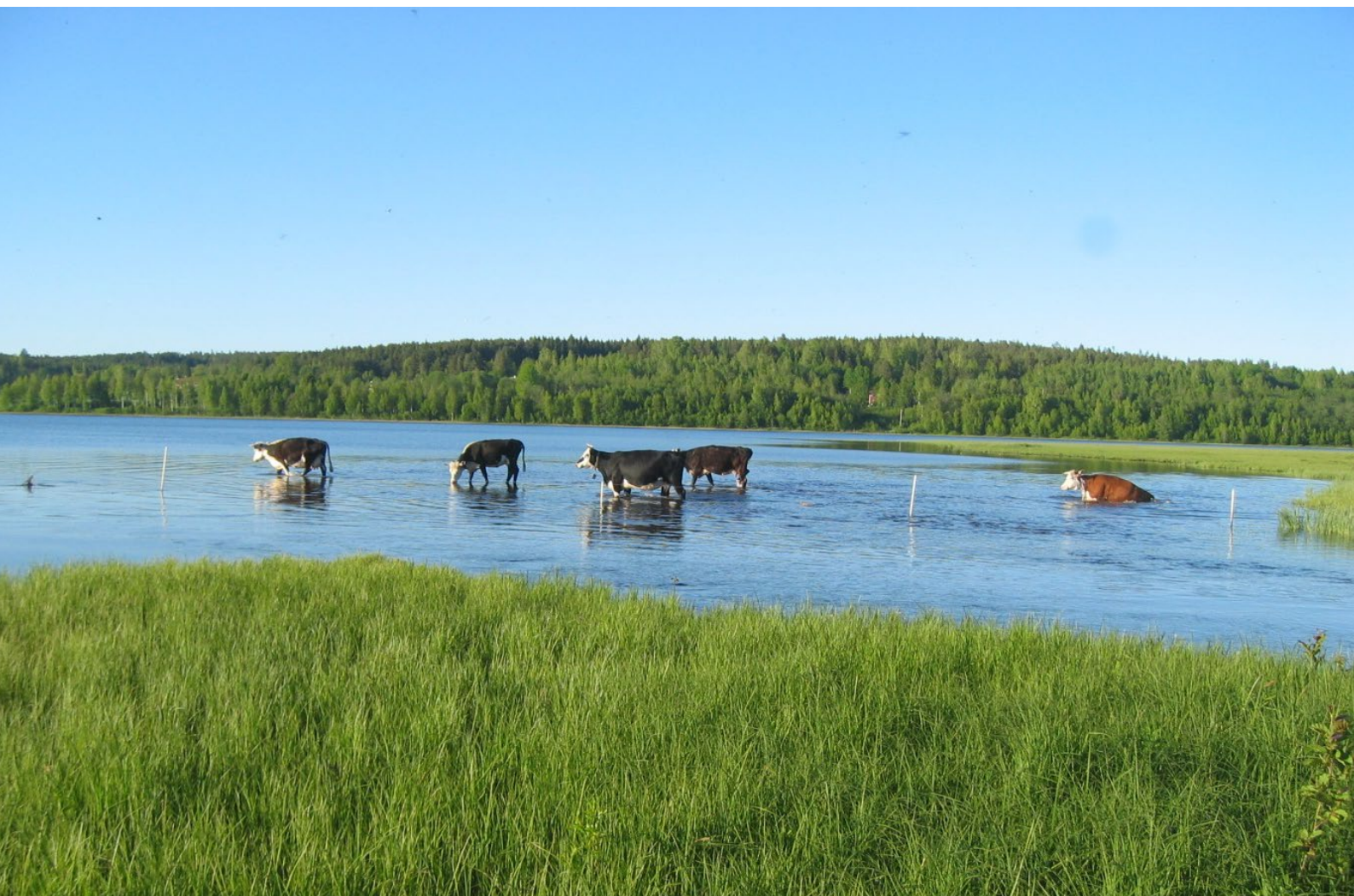
Natur och friluftsliv vid Skrängstasjön...