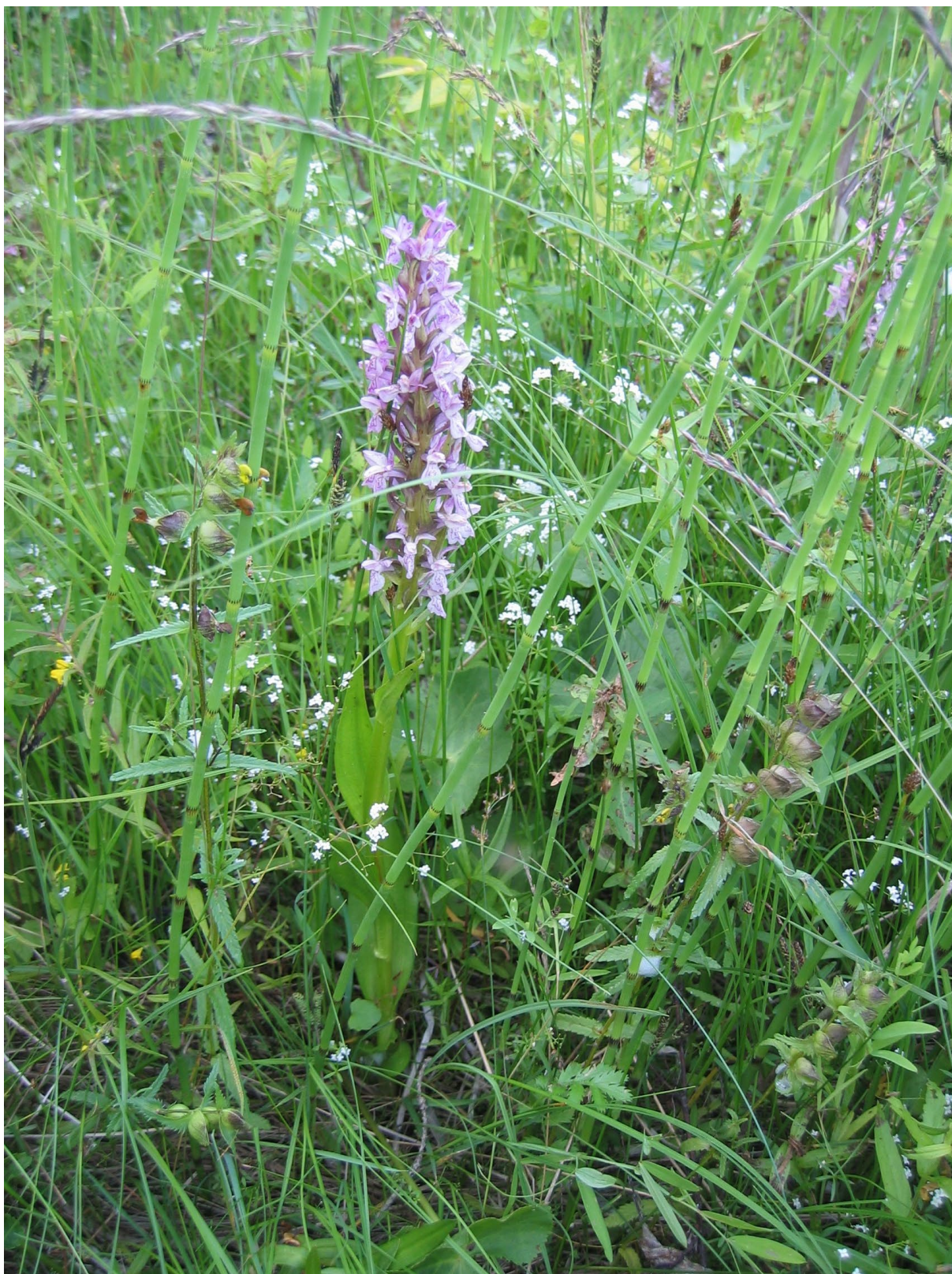
Strandäng vid havet med den fridlysta orkidéen ängsnycklar